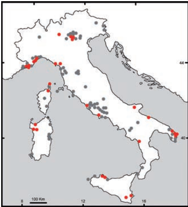
Fig. 4 - Distribuzione dei siti italiani in cui sono state rinvenute e studiate avifaune pleistoceniche (in grigio). In rosso sono evidenziati i siti ove sono stati rinvenuti resti di Columba livia . / Distribution map of the Italian Pleistocene fossil localities with birds remains (in grey). In red are highlighted the localities in which remains of Columba livia have been found.

et là dans les falaises de Bretagne, du Midi et de Corse. Il est probable que les Pigeons qui nichent dans quelque rochers de montagnes (Alpes, Pyrenees, etc) ne sont que de Pigeons domestiques revenus depuis plus ou moins longtemps à l'état sauvage et qui s'y perpétuent.» (Geroudet, 1947).