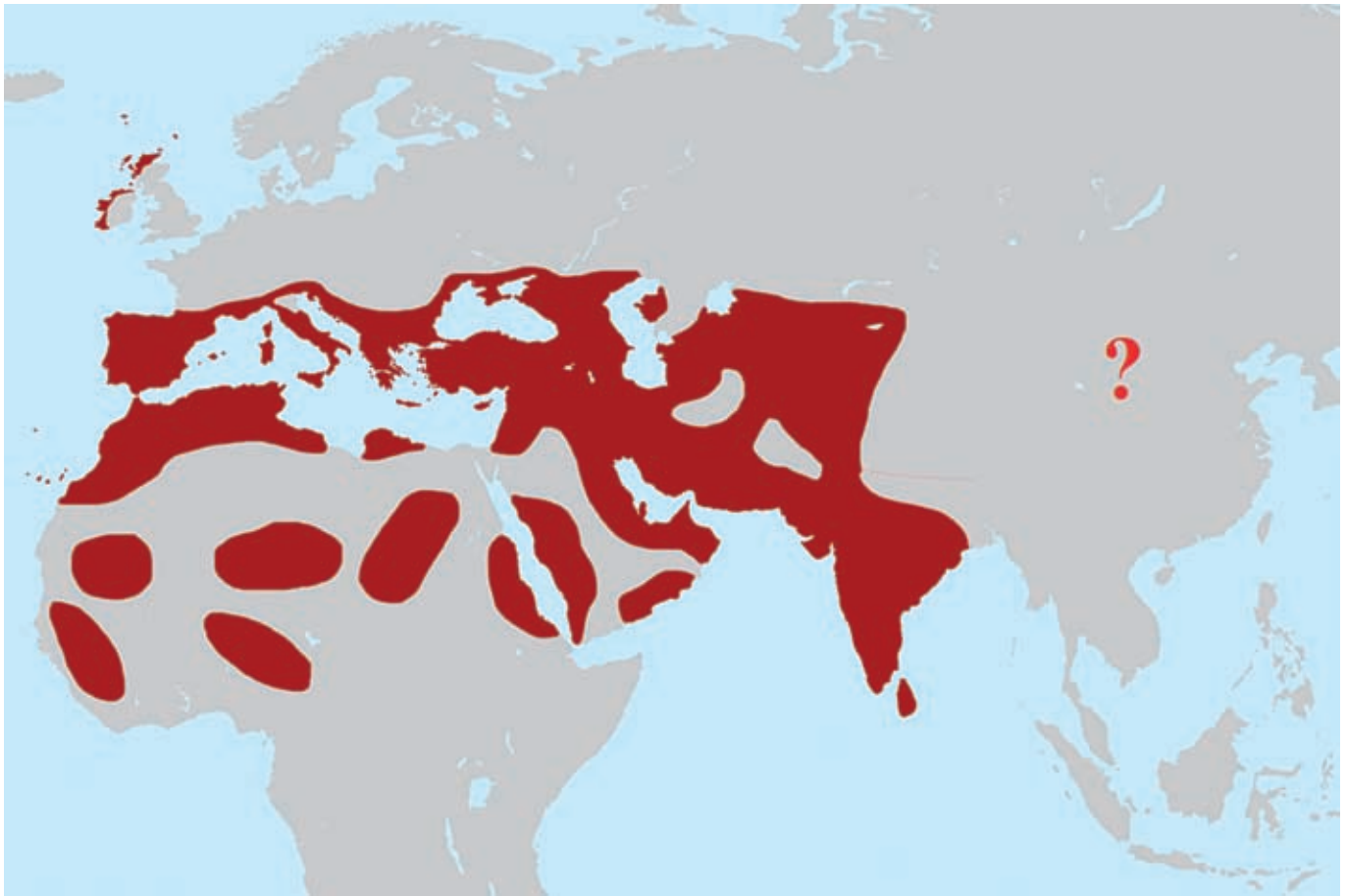
Fig. 1 - Areale originario presunto di Columba livia ; la popolazione del nord della Cina (?) è ritenuta di origine domestica. / Presumed original distribution area of Columba livia , the population of the North of China (?) is considered to be of domestic origin.

razze sono state selezionate in principio per l'alimentazione umana e come offerta sacrificale (Borowski, 1999), in seguito anche come colombe viaggiatori o come animali da affezione.