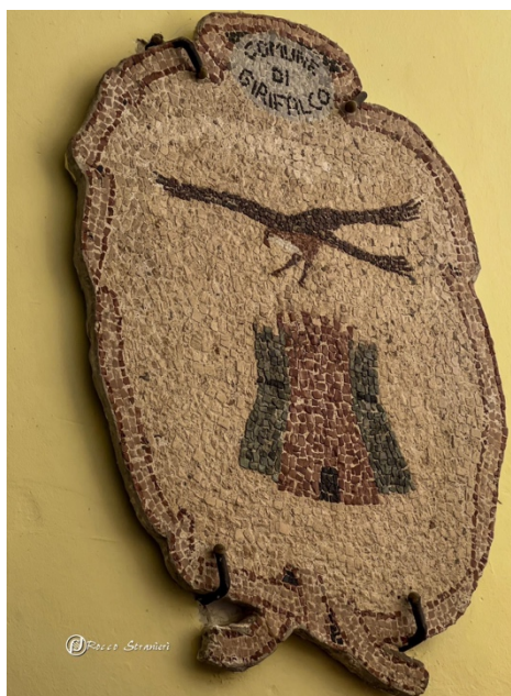
Fig. 2 – Stemma del comune di Girifalco raffigurante tre torri sorvolate da un falco. / Coat of arms of the municipality of Girifalco depicting three towers flown over by a hawk.