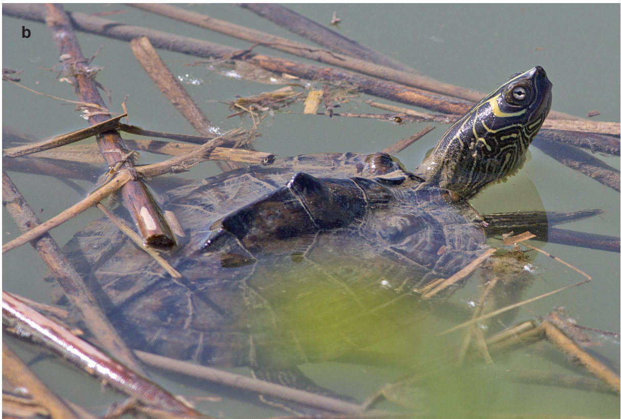
Fig. A8 - Mississippi map turtle G. p. pseudogeographica (Gray 1831) (a) and Northern false map turtle G. p. kohnii (Baur 1890) (b) in the Parco Lago Nord. / G. p. pseudogeographica (Gray 1831) (a) e G. p. kohnii (Baur 1890) (b) nel Parco Lago Nord. (Photo: / Foto: Foglini C.).