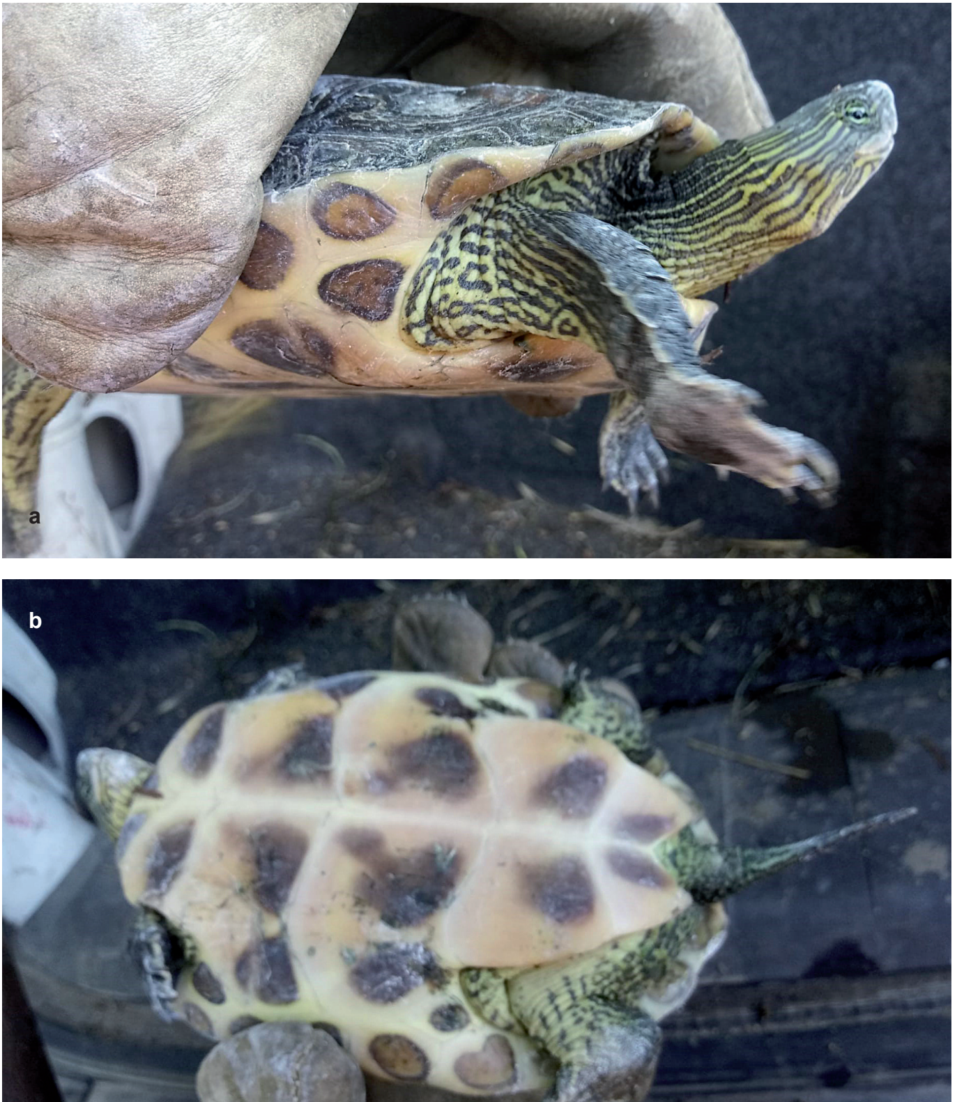
Fig. A4 - Chinese stripe-necked turtle Mauremys sinensis (Gray, 1834) incidentally captured by the park's staff during wetland maintenance on 24 June 2020 in the Cinisello Lake. Side (a) and ventral (b) views. / Mauremys sinensis (Gray, 1834) accidentalmente rinvenuta dallo staff di Parco Nord Milano durante lavori di manutenzione del Lago Cinisello il 24 giugno 2020. Vista laterale (a) e ventrale (b). (Photo: / Foto: Tucci R.).