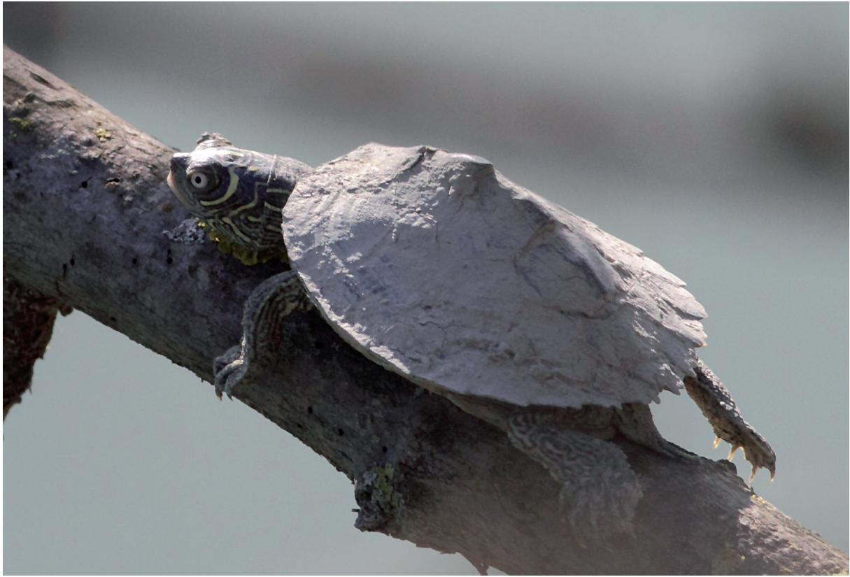
Fig. A9 - Juvenile Northern false map turtle G. p. kohnii sighted on 27 October 2019 in the Parco Lago Nord. It is hard to say if it is a released pet or was locally born. / Giovane di G. p. kohnii osservato il 27 ottobre 2019 nel Parco Lago Nord. Difficile stabilire se sia stato rilasciato da cattività o se sia nato in loco.