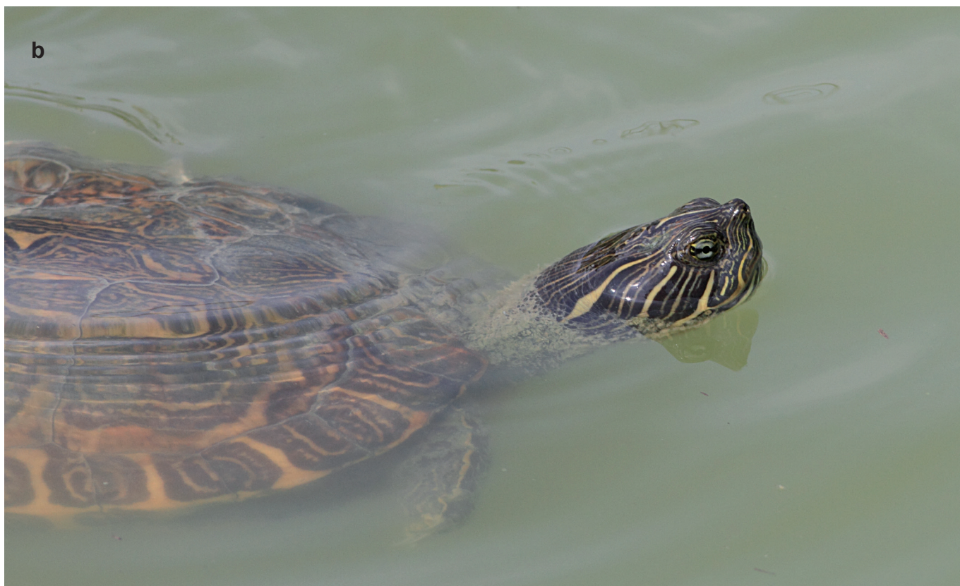
Fig. A6 - Pseudemys in the Parco Lago Nord: Florida red-bellied cooter P. nelsoni (Carr 1938) (a) and river cooter P. concinna (Le Conte 1830) (b). / Pseudemys nel Parco Lago Nord: P. nelsoni (Carr 1938) (a) e P. concinna (Le Cote 1830) (b).