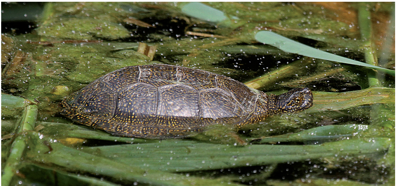
Fig. A2 - European pond turtle Emys orbicularis (L. 1758) in the Environmental Education Area on 8 June 2016. Sighted again only once in summer 2017. / Testuggine palustre europea Emys orbicularis (L. 1758) osservata l'8 giugno 2016 nell'Area Didattica Naturalistica. Rivista solo una volta durante l'estate 2017. (Photo: / Foto: Ghisladi A. e M.).