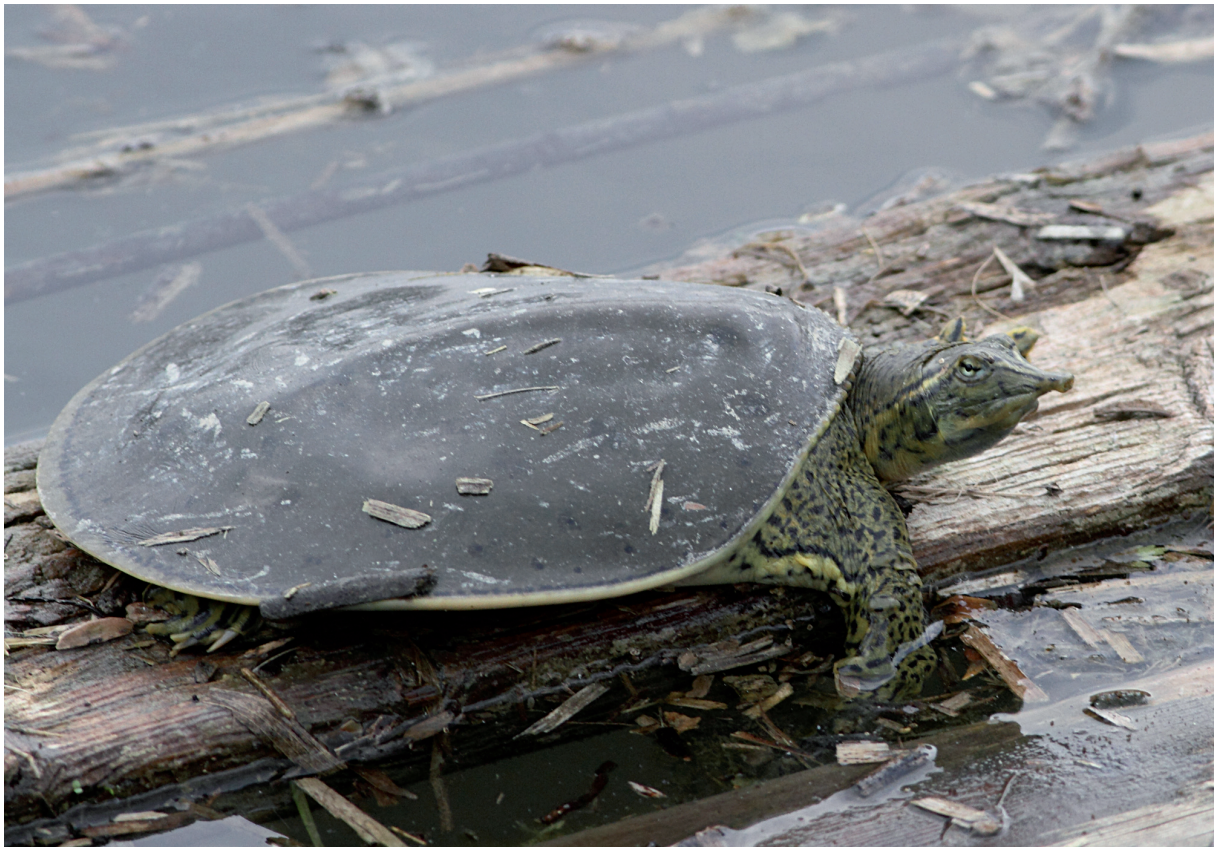
Fig. A11 – the spiny softshell turtle Apalone spinifera (Lesueur 1827) sighted only once on 19 May 2018 in the Parco Lago Nord. / A. spinifera (Lesueur 1827) osservata unicamente il 19 maggio 2018 nel Parco Lago Nord. (Photo: / Foto: Foglini C.).