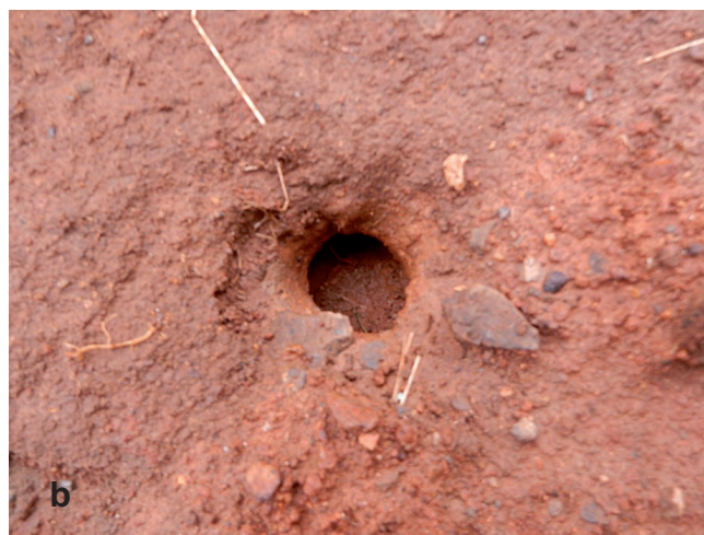
Fig. A14 - (a) The nest-digging female false map turtle G. pseudogeographica (Gray 1831) sighted on 5 July 2018 near the Bresso Lakes. (b) Upon inspection, the nest was found to be empty and not completely covered. / (a) Femmina di G. pseudogeographica (Gray 1831) intenta nello scavo del nido il 5 luglio 2018 sulle sponde del Laghetto Bresso. (b) All'ispezione, il nido risultò vuoto e non completamente ricoperto. (Photo: / Foto: Gelso M. R.).