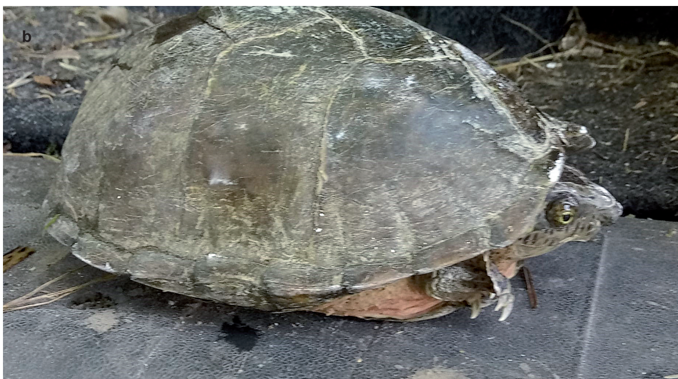
Fig. A5 - Razor-backed musk turtle Sternotherus carinatus (Gray 1856) captured along with M. sinensis in the Cinisello Lake. Head (a) and carapace (b) views. / Sternotherus carinatus (Gray 1856) rinvenuto insieme a M. sinensis nel Lago Cinisello. Foto del capo (a) e del carapace (b). (Photo: / Foto: Tucci R.).