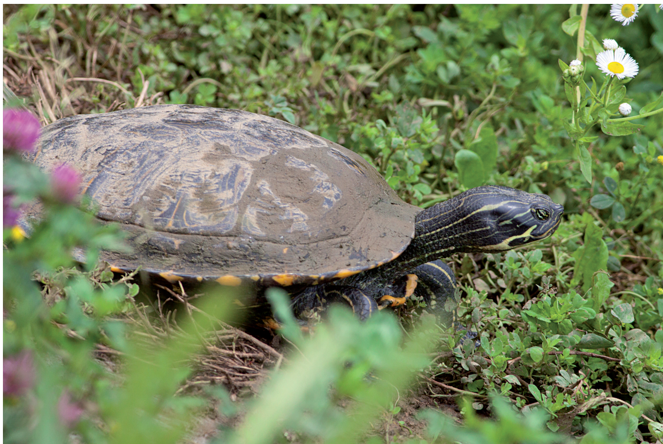
Fig. A13 - A river cooter P. concinna (Le Conte 1830) in Sant'Eusebio protected area. / P. concinna (Le Conte 1830) nell'Oasi di Sant'Eusebio.