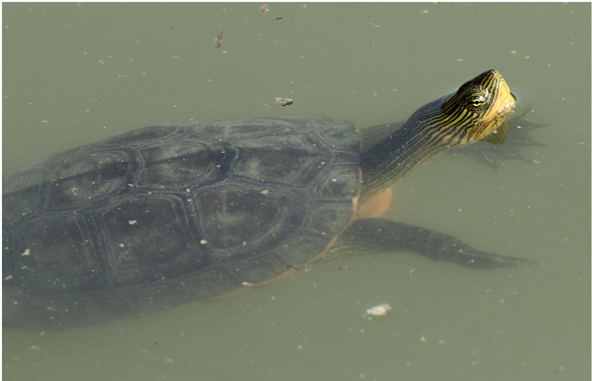
Fig. A12 - A basking Chinese stripe-necked turtle Mauremys sinensis (Gray 1834) first reported in the Parco Lago Nord on 18 September 2020. / M. sinensis (Gray 1834) in termoregolazione, avvistata per la prima volta nel Parco Lago Nord il 18 settembre 2020. (Photo: / Foto: Foglini C.).