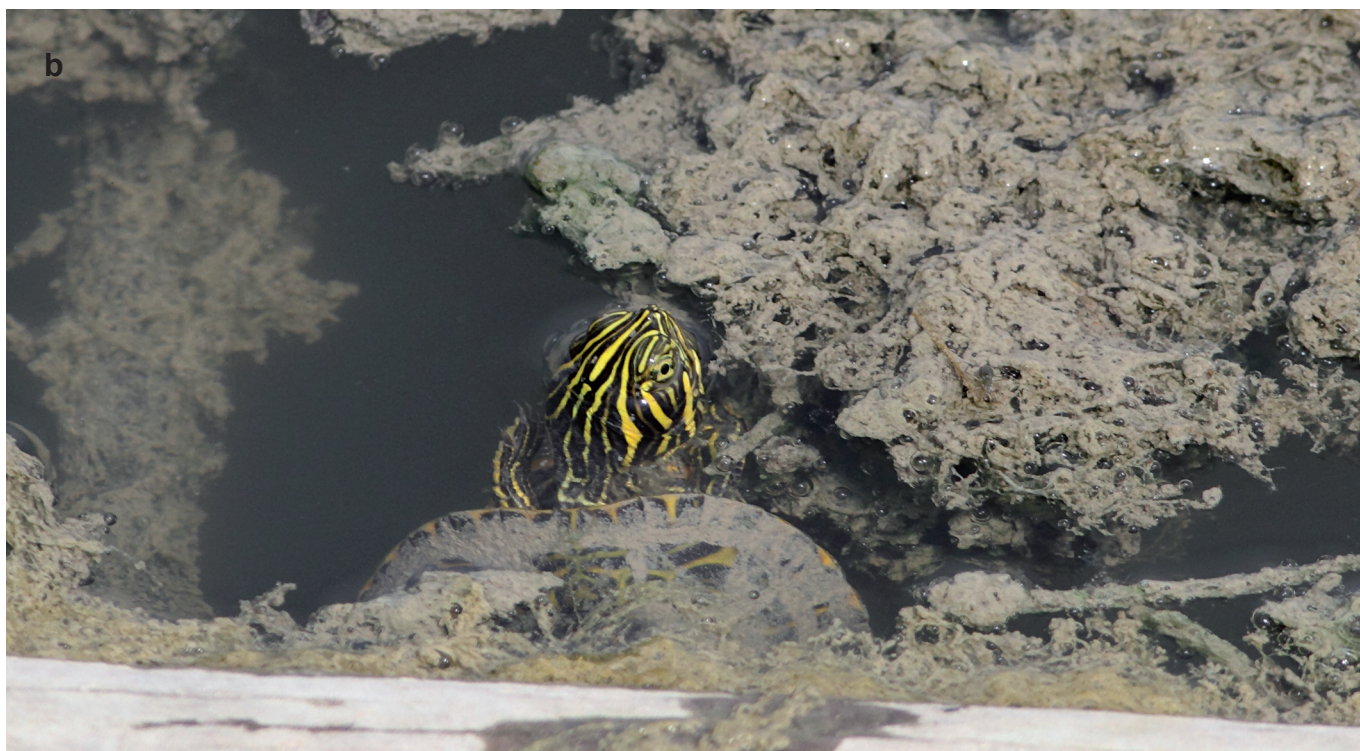
Fig. A7 – Two small Pseudemys in the Parco Lago Nord. Juveniles are elusive and identification through photos taken from a distance is difficult. They are likely P. cfr nelsoni (a) and P. cfr concinna (b). / Due piccole Pseudemys nel Parco Lago Nord. I giovani sono elusivi e l'identificazione mediante foto scattate da lontano è difficoltosa. Probabilmente si tratta di P. cfr nelsoni (a) e P. cfr concinna (b). (Photo: / Foto: Foglini C.).