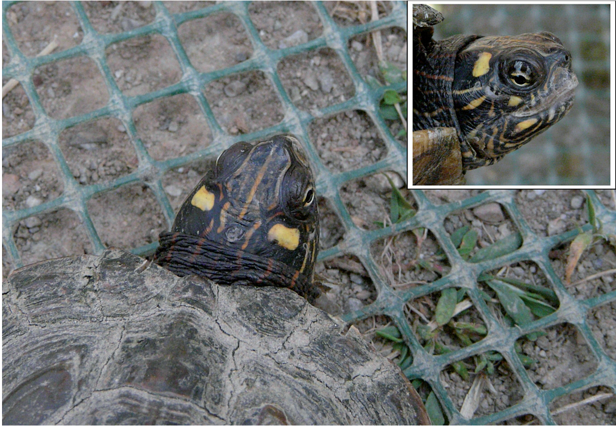
Fig. A1 - Ouachita map turtles Graptemys ouachitensis (Cagle 1953) in the Parco Nord Milano, with head detail. / Graptemys ouachitensis (Cagle 1953) a Parco Nord Milano, con dettaglio del capo. (Photo: / Foto: Foglini C.).

Appendix 1 - Photographs of some species observed in the study area. Locality names as in Fig. 1. / Foto di alcune delle specie osservate nell'area di studio. Nomi delle località come in Fig. 1.