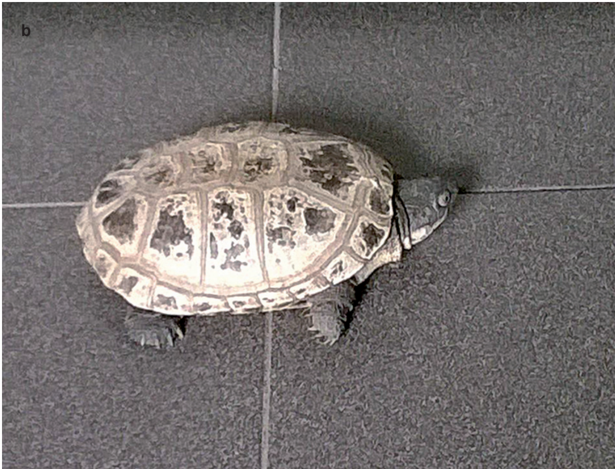
Fig. A3 – Helmeted turtle Pelomedusa subrufa (Bonnaterre 1789) recovered on 27 July 2017 in the Parco Nord Milano by the Park's voluntary environmental surveillance service (GEV – Guardie Ecologiche Volontarie). Front (a) and dorsal (b) views. / Individuo di Pelomedusa subrufa (Bonnaterre 1789) recuperato il 27 luglio 2017 a Parco Nord Milano dalle G.E.V del Servizio Volontario di Vigilanza Ecologica. Vista frontale (a) e dorsale (b).