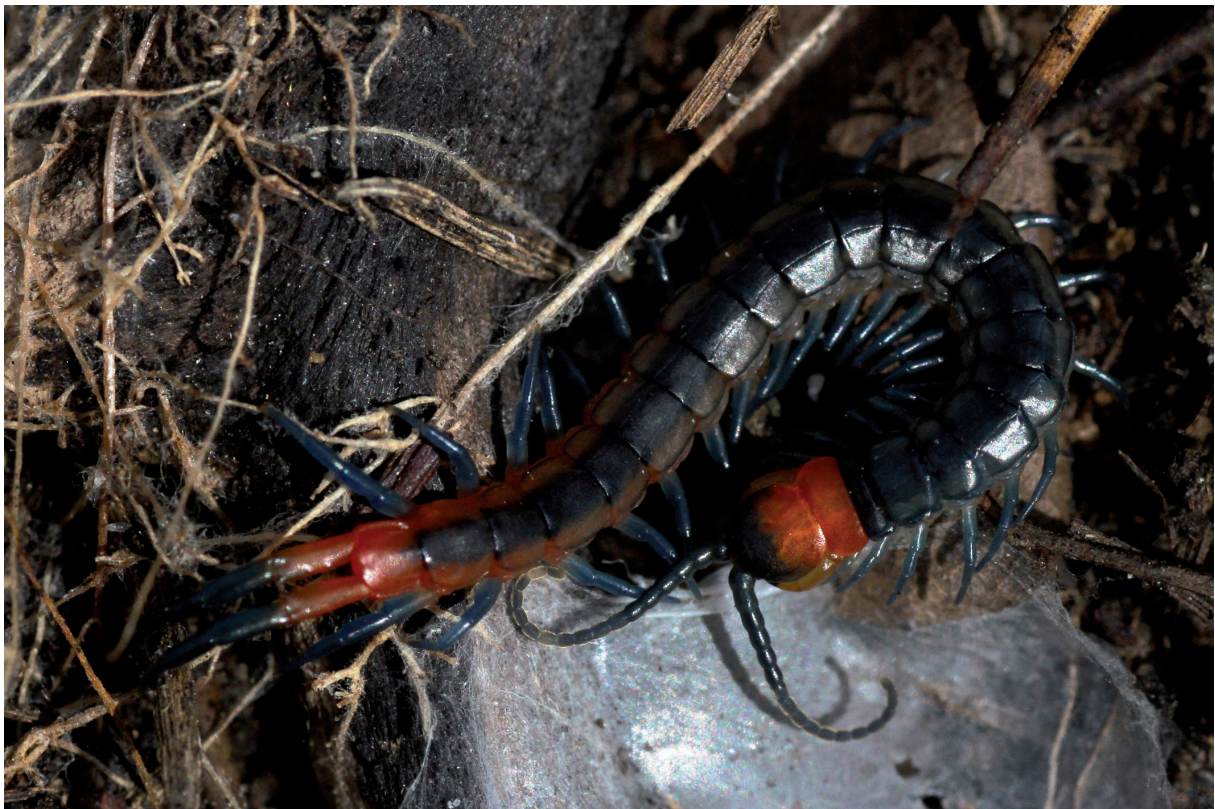
Fig. 2 - Juvenile Scolopendra cingulata , observed on 9 April 2021. / Giovane di Scolopendra cingulata osservato il 9 aprile 2021. (Photo / Foto: Luca Anselmo).